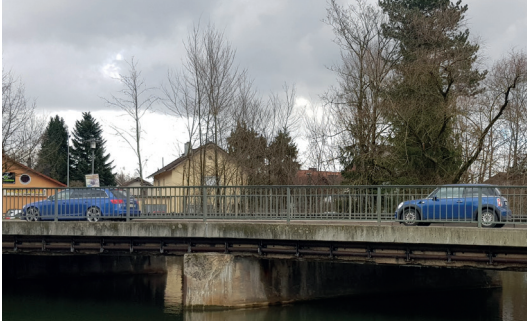
Die alte Isenbrücke

Die B15-Isenbrücke in Dorfen stammt aus dem Jahr 1936. Aufgrund ihres Alters und der massiven Schäden infolge der langjährigen Verkehrsbelastung lohnt sich eine Sanierung nicht mehr. Deshalb wird die Brücke abgerissen und durch einen Neubau ersetzt.